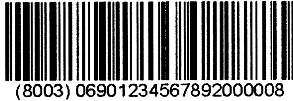
图 B.4 用商品条码 128 条码标识的 × × × 公司可回收塑料托盘条码标签示例