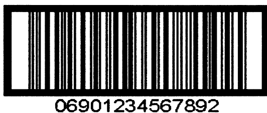
图 B.1 储运包装单元条码标签示例