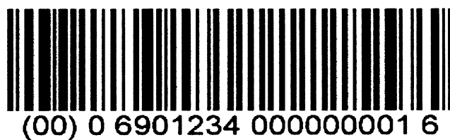
图 B.2 物流单元条码标签示例